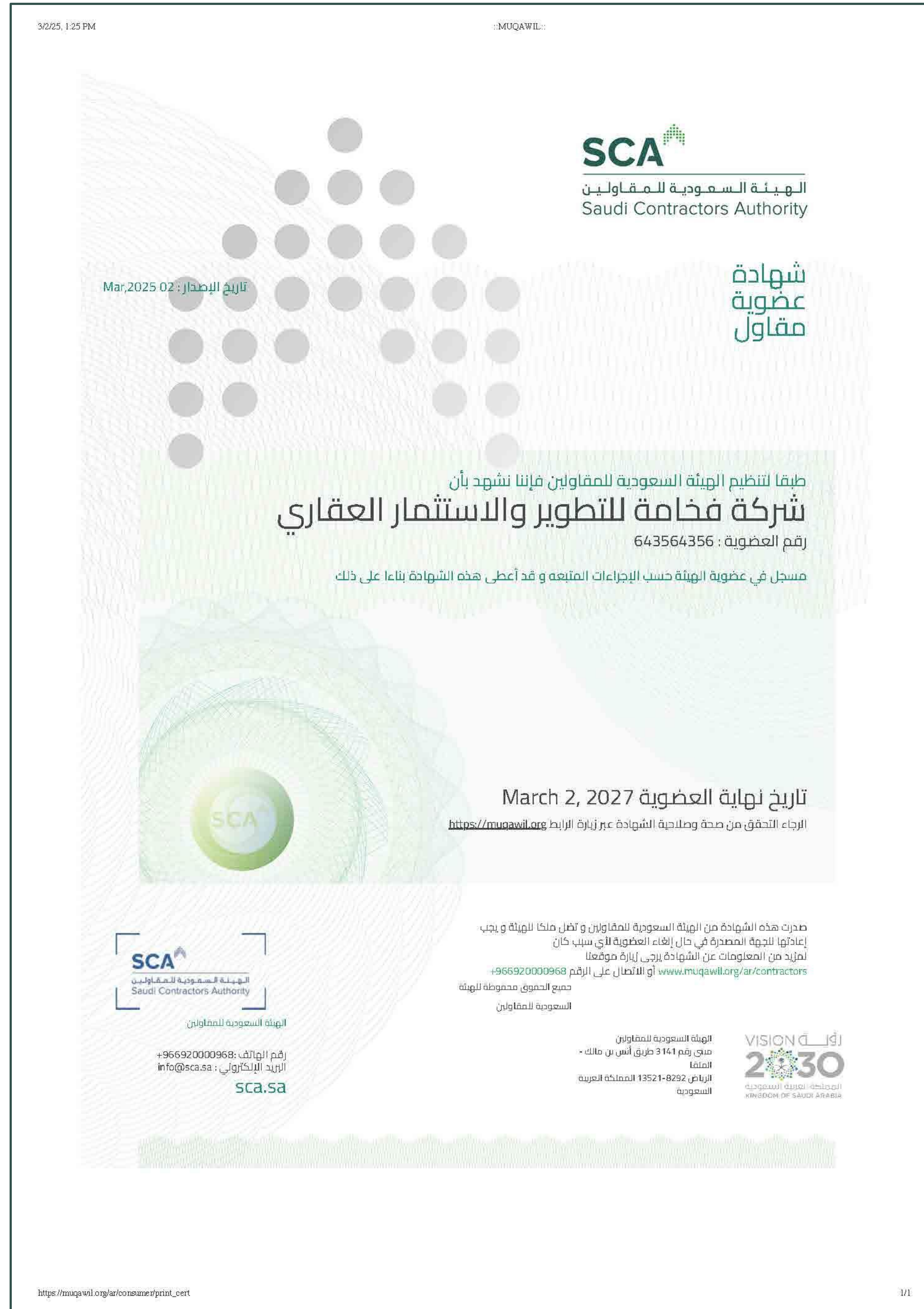
شهادة عضوية مقاول