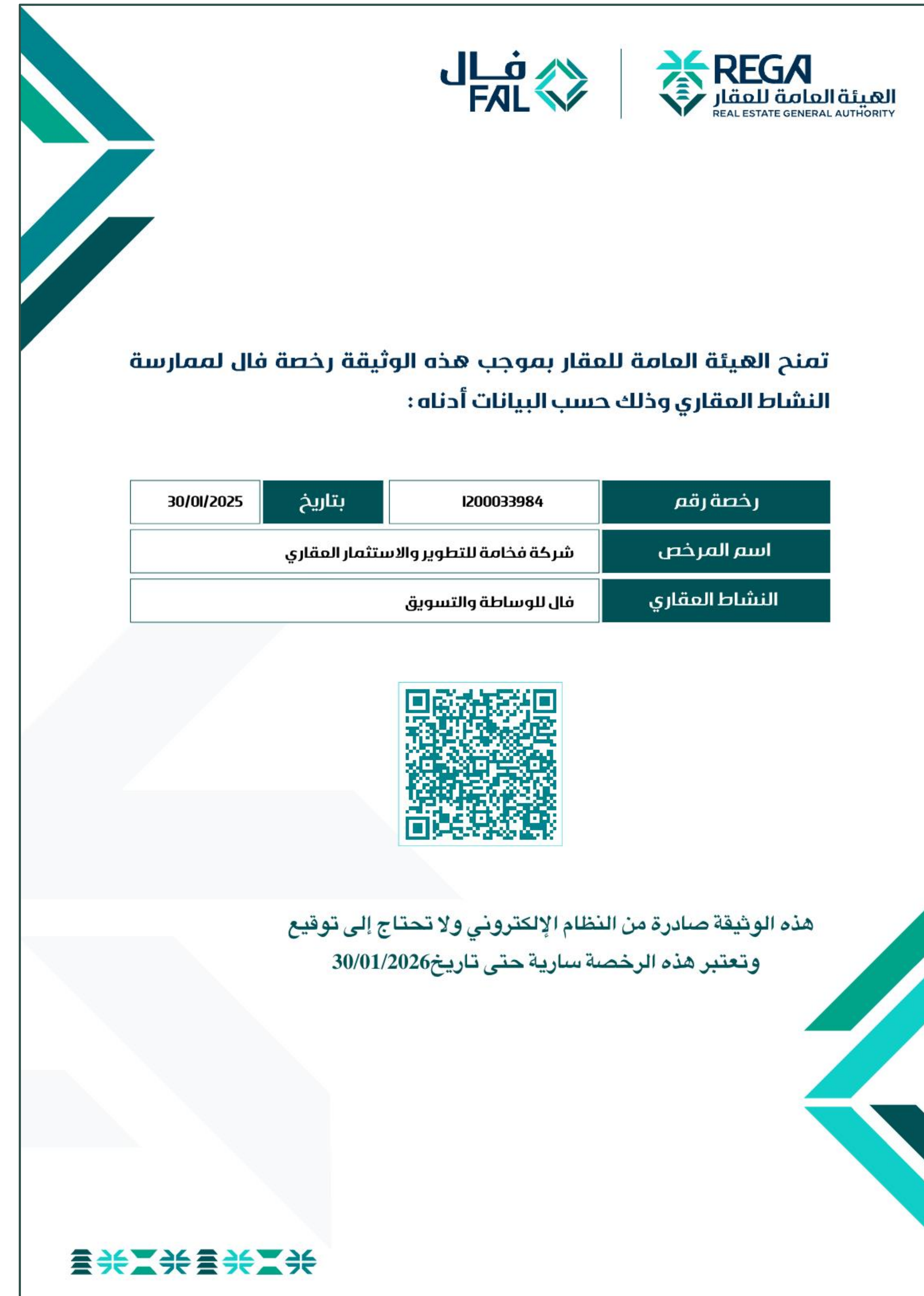
شهادة فال للوساطة والتسويق